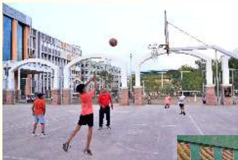
Basket Ball Court