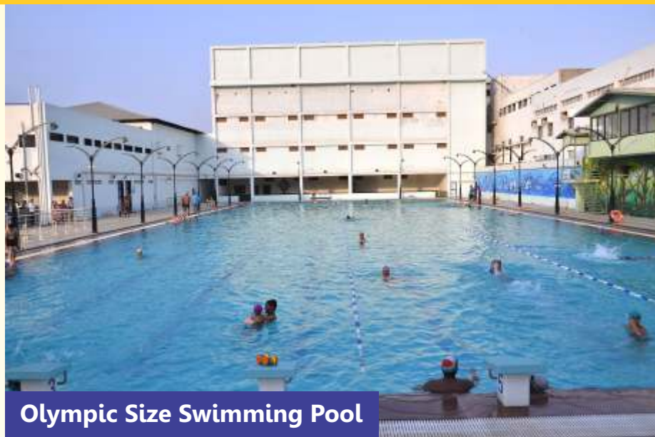
Olympic Size Swimming Pool