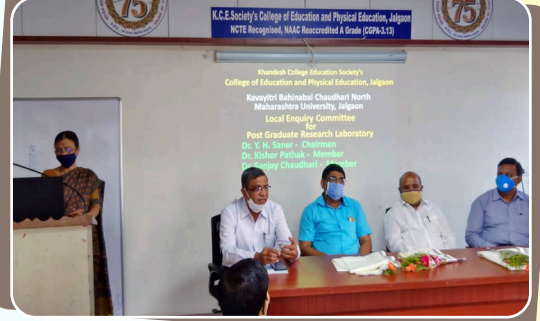
संशोधन विभागांतर्गत विशेष उपक्रम