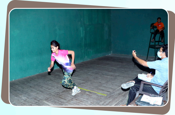
शारीरिक शिक्षण अभ्यासक्रमाच्या प्रवेश परिक्षेचे आयोजन