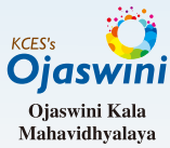
Ojaswini Kala Mahavidhyalaya