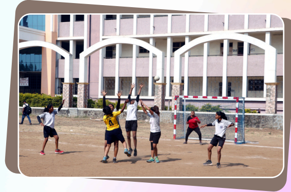
जळगाव विभाग आंतरमहाविद्यालयीन महिला हॅन्डबॉल स्पर्धा