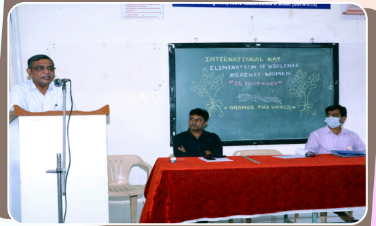
वक्तृत्व विकास कार्यशाळा