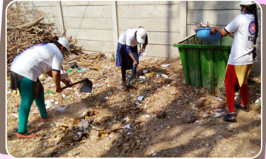
राष्ट्रीय सेवा योजना अंतर्गत स्वच्छता उपक्रम