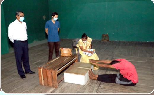
शारीरिक शिक्षण अभ्यासक्रमाच्या प्रवेश चाचणीचे आयोजन