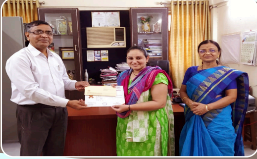
गुणवंत विद्यार्थ्यांना विशेष शिष्यवृत्ती वाटप