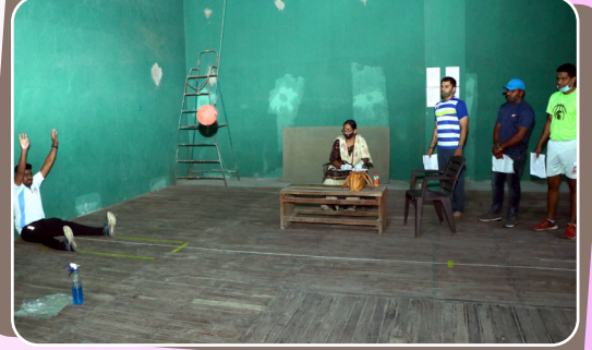
शारीरिक शिक्षण अभ्यासक्रमाच्या प्रवेश चाचणीचे आयोजन