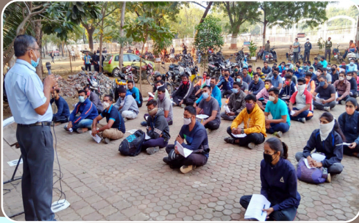
शारीरिक शिक्षण अभ्यासक्रम उद्बोधन