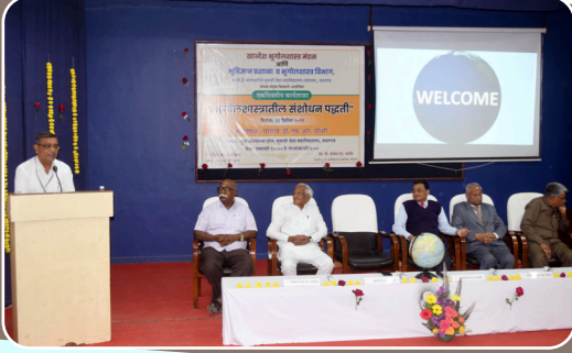
राष्ट्रीय शैक्षणिक धोरण २०२० विषयावर आयोजित उद्बोधन वर्ग