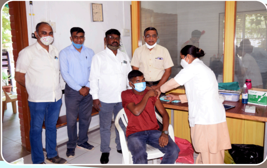
विद्यार्थी आरोग्य तपासणी व कोरोना लसिकरण कार्यक्रम