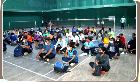
शारीरिक शिक्षण अभ्यासक्रमाच्या प्रवेश चाचणीचे आयोजन