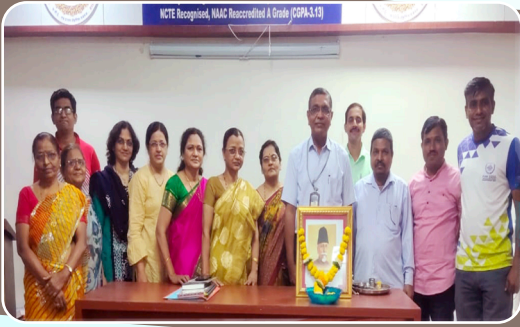
मौलाना अबुल कलाम आझाद जयंती राष्ट्रीय शिक्षण दिन समारंभ