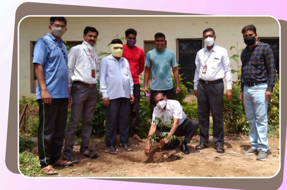
राष्ट्रीय सेवा योजना अंतर्गत वृक्षारोपण