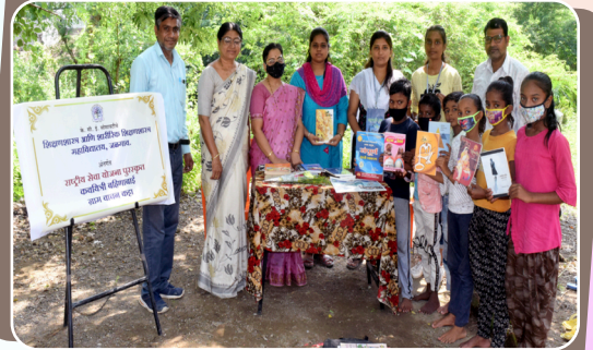
राष्ट्रीय सेवा योजना उपक्रम