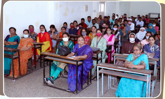
महाविद्यालयातील उद्बोधन कार्यक्रम