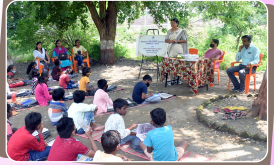
राष्ट्रीय सेवा योजना उपक्रम