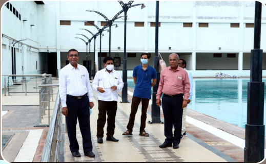
स्थानिक चौकशी समितीद्वारे महाविद्यालयातील सुविधांचे गुणांकन