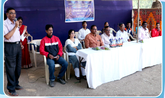
जळगाव विभाग आंतरमहाविद्यालयीन हॅडबॉल स्पर्धा