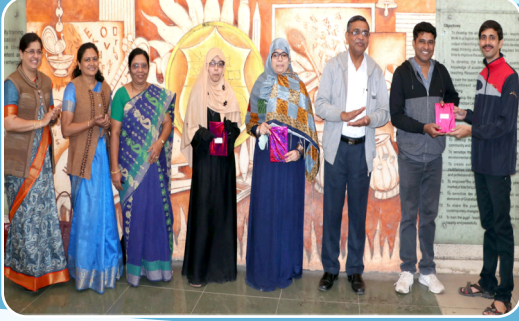
वक्तृत्व स्पर्धेत विजयी विद्यार्थ्यांचा कौतुक समारंभ