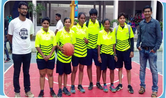
जळगाव विभाग आंतरमहाविद्यालयीन बास्केटबॉल स्पर्धा - महाविद्यालयाचा महिला संघ