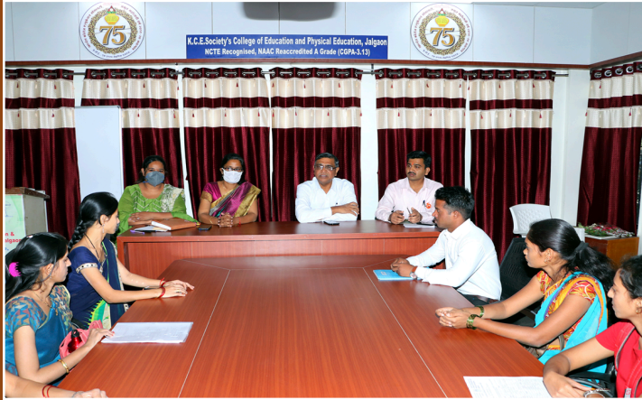
कॅम्पस प्लेसमेंट इंटरव्यूह