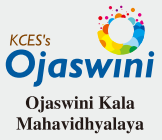
Ojaswini Kala Mahavidhyalaya