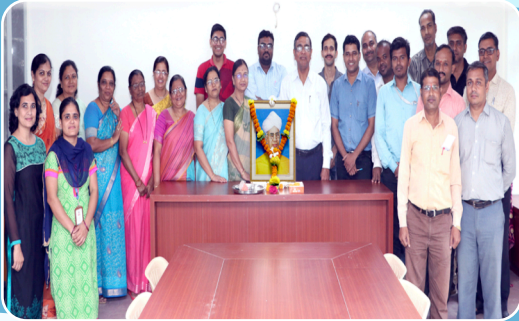
शिक्षण दिन समारंभ