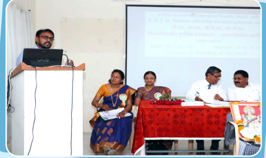
विद्यार्थ्यांसाठी सुक्ष्म कौशल्य विकास कार्यशाळा