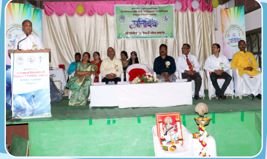
महाविद्यालयाचा वार्षिक सांस्कृतिक व विद्यार्थी गौरव समारंभ