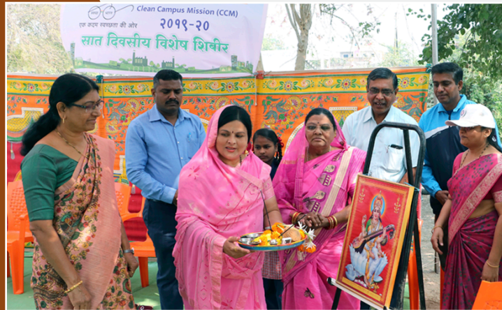
राष्ट्रीय सेवा योजनेंतर्गत सात दिवसीय विशेष शिबीर