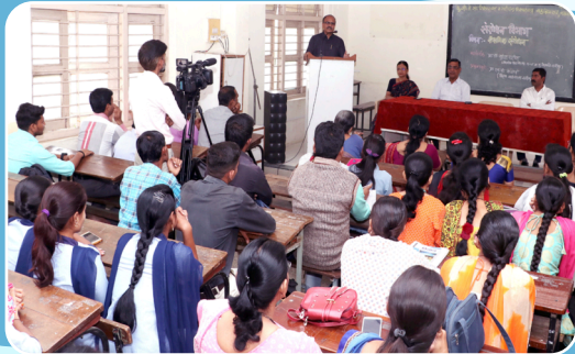
विद्यार्थ्यांसाठी संशोधन विभागाद्वारे शैक्षणिक संशोधन विषयावर आयोजित व्याख्यान