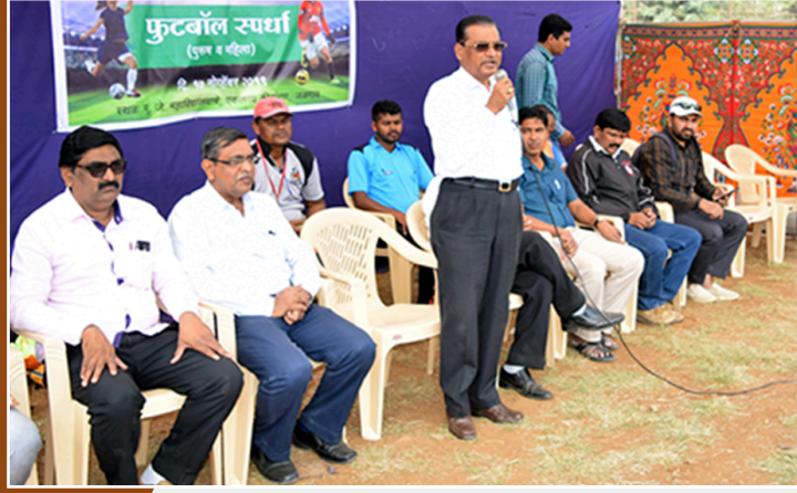
जळगाव विभाग आंतरमहाविद्यालयीन फुटबॉल स्पर्धा