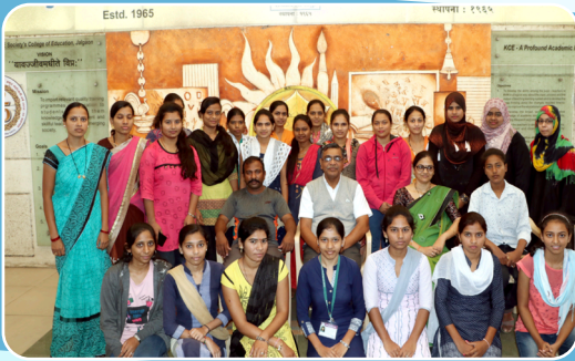
महिला सबलीकरण उपक्रमांतर्गत स्वयंसिद्धा प्रशिक्षण