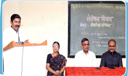
विद्यार्थ्यांसाठी संशोधन विभागाद्वारे शैक्षणिक संशोधन विषयावर आयोजित व्याख्यान