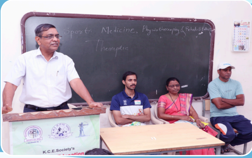
शारीरिक शिक्षणशास्त्र विभागातील विद्यार्थ्यांशी प्राचार्य संवाद