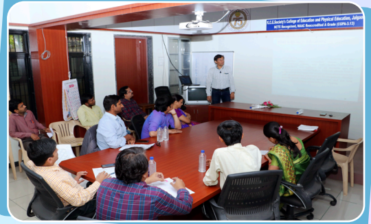
विद्यार्थ्यांसाठी समावेशीत शिक्षण आधारीत कार्यशाळा