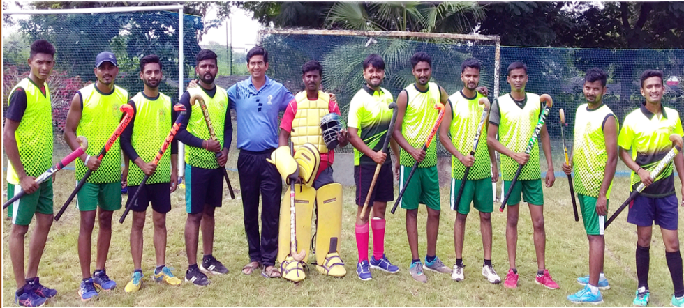
जळगाव विभाग आंतरमहाविद्यालयीन हॉकी स्पर्धा महाविद्यालयाचा संघ पुरुष