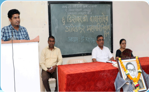
डॉ. बाबासाहेब आंबेडकर महापरिनिर्वाण दिन समारंभ