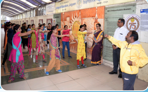
महिला सबलीकरण उपक्रमांतर्गत स्वयंसिद्धा प्रशिक्षण