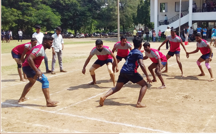
जळगाव विभाग आंतरमहाविद्यालयीन कबड्डी स्पर्धा