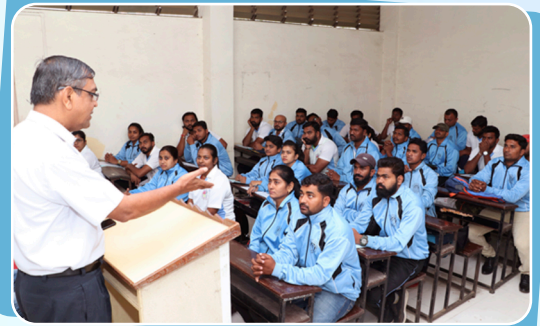
शारीरिक शिक्षणशास्त्र विभागातील विद्यार्थ्यांशी प्राचार्य संवाद