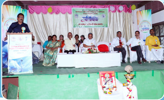
महाविद्यालयाचा वार्षिक सांस्कृतिक व विद्यार्थी गौरव समारंभ