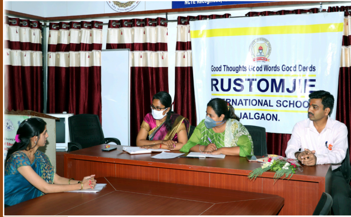
कॅम्पस प्लेसमेंट इंटरव्यूह