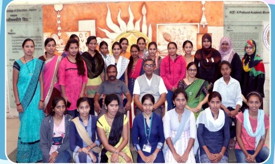
महिला सवलीकरण उपक्रमांतर्गत स्वयंसिद्धा प्रशिक्षण