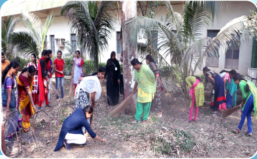
राष्ट्रीय सेवा योजनेच्या अंतर्गत महाविद्यालयात स्वच्छता अभियान