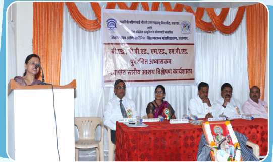
विद्यापीठाच्या सुधारीत अभ्यासक्रमावर आधारित आशय विश्लेषण कार्यशाळा